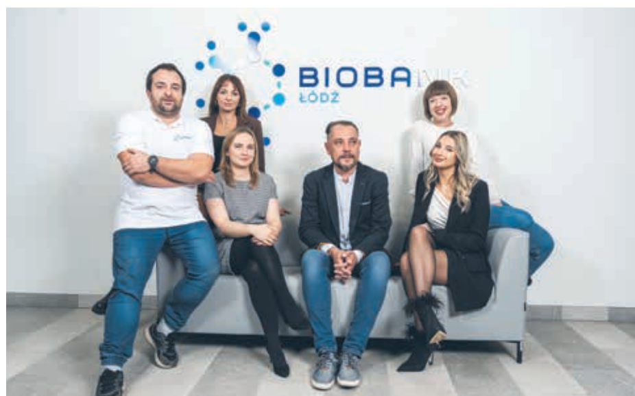
Zespół naukowców z Biobank Łódź@ Uniwersytetu Łódzkiego jest gotowy do działania. Aleksandrowianie mają wyjątkową okazję, by zadbać o swoje zdrowie i dobrze przysłużyć się nauce.

Do badania mogą się zgłosić 5-osobowe rodziny, obejmujące trzy pokolenia. Uczestnicy nie muszą być bezpośrednio spokrewnieni. Warunkiem udziału jest natomiast zamieszkiwanie na terenie gminy Aleksandrowa Łódzki. Najmłodszy członek rodziny powinien mieć co najmniej 10 lat.