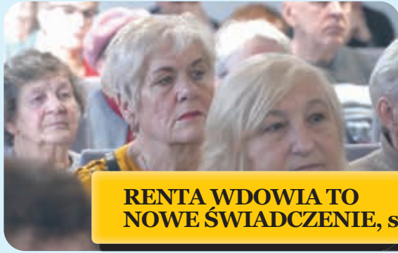
RENTA WDOWIA TO NOWE ŚWIADCZENIE, s. 4