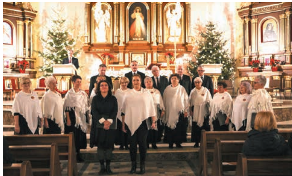
Podziękowania należą się Towarzystwu Śpiewaczemu „Lutnia”, który nie tylko wspaniale zaprezentował się podczas festiwalu, ale zorganizował też poczęstunek dla wszystkich uczestników.