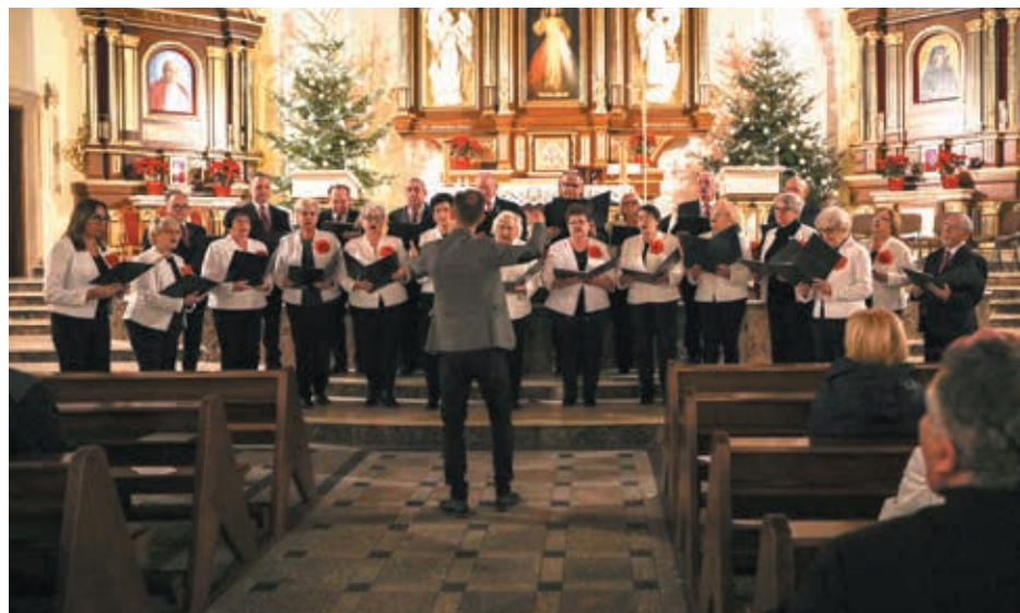
Drugim chórem działającym w naszej gminie, który zaprezentował się podczas tego popołudnia, był chór Towarzystwa Śpiewaczego im. Stanisława Moniuszki. Chór ponad 100 lat temu zaczynał swoją działalność jako chór kościelny.

element świąt Bożego Narodzenia, zarówno w domach, jak i podczas specjalnych koncertów czy spotkań oplatkowych. (who)