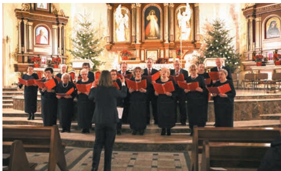
Chór działający przy parafii pw. Świętych Archaniołów Michała, Gabriela i Rafała rozpoczął festiwal kolęd i pastorałek.

ły się w XV wieku, a jedną z najstarszych jest „Anioł pasterzom mówił”. Kolędy i pastorałki to tradycyjne pieśni świąteczne, które od wieków towarzyszą obchodom Bożego Narodzenia. Choć często używa się tych terminów zamiennie, istnieją między nimi istotne różnice. Kolędy to religijne pieśni bożonarodzeniowe, które opowiadają o narodzinach Jezusa Chrystusa, aniołach, pasterzach, Trzech Królach i wydarzeniach związanych z Betlejem. Mają podniosły, uroczysty charakter. Ich cechą charakterystyczną jest silne zakorzenienie w liturgii oraz tradycji chrześcijańskiej. Pastorałki to bardziej swobodne, często wesołe pieśni o tematyce bożonarodzeniowej. Choć także odnoszą się do narodzin Jezusa, są mniej oficjalne