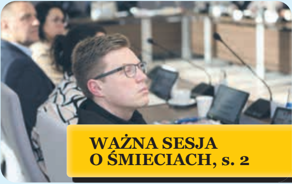
WAŻNA SESJA O ŚMIECIACH, s. 2