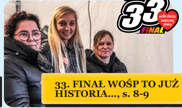
33. FINAŁ WOŚP TO JUŻ HISTORIA..., s. 8-9