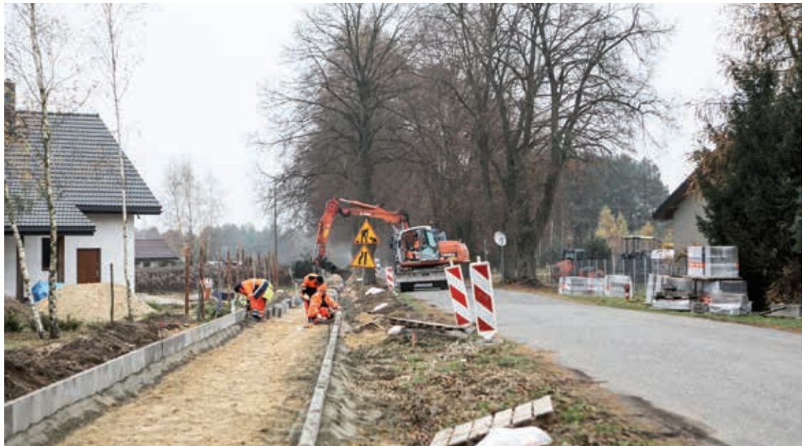
Budowa ścieżek rowerowych to jedna z najtrudniejszych gminnych realizacji. Do tego również kosztowna, bo 1 km średnio kosztuje 1 mln złotych. Dokumentacja jest już gotowa, same prace wykonawcze przy dobrej firmie to tylko formalność.

Do tej pory aleksandrowski samorząd wybudował już 4 kilometry ścieżek rowerowych w gminie. Z odcinkiem Bełdów-Słowak będzie w sumie 6 kilometrów. Milowymi krokami zbliżamy się do momentu połączenia wszystkich odcinków w jedną trasę zaczynającą i kończącą się w centrum Aleksandrowa. To będzie trzeci etap inwestycji, na który z niecierpliwością czekają mieszkańcy, a gmina czeka na środki zewnętrzne. (ak)