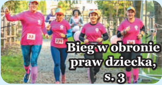
Bieg w obronie praw dziecka, s. 3