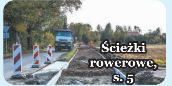
Ścieżki rowerowe, s. 5

BIULETYN INFORMACYJNY URZĘDU MIEJSKIEGO W ALEKSANDROWIE ŁÓDZKIM