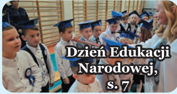
Dzień Edukacji Narodowej, s. 7